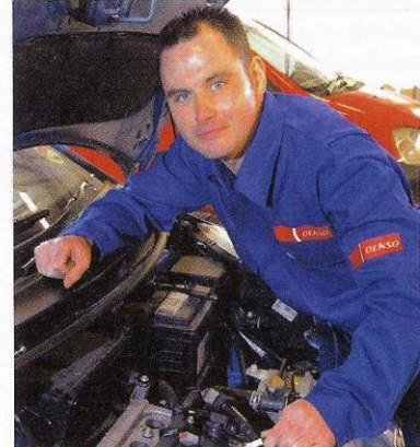
Schon seit Jahren ist der Service-Bereich unbestritten eine der tragenden Säulen für den gesamten Kfz-Aftermarket.

Die Reparaturschnelligkeit trägt für Gebrauchtwagenkunden mit einem Wert von 26 Prozent einen großen Teil zur Wahlentscheidung bezüglich der Autowerkstatt bei. Hintergrund sind die aufgrund der Nichtnutzung des Fahrzeugs entstehenden Opportunitätskosten sowie zusätzliche Investitionen wie beispielsweise für alternative Verkehrsmittels oder für einen in dieser Zeit genutzten Leihwagen. Die hohe Bedeutung einer möglichst schnellen Reparatur ohne Verzögerungen durch ständigen Abstimmungsbedarf ist für den Autobesitzer damit äußerst plausibel. Bei Neuwagenbesitzer hat die Reparaturschnelligkeit hingegen eine geringere Bedeutung. „Diese Personengruppe scheint ein höheres Risiko wahrzunehmen als Gebrauchtwagenbesitzer, so dass zu Gunsten einer qualitativ hochwertigen Arbeit eine länger dauernde Reparatur akzeptiert wird“, so Hans Herrmann, Leiter des Bereichs Automotive bei 2hm & Associates.